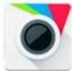
Photo Editor von Aviary